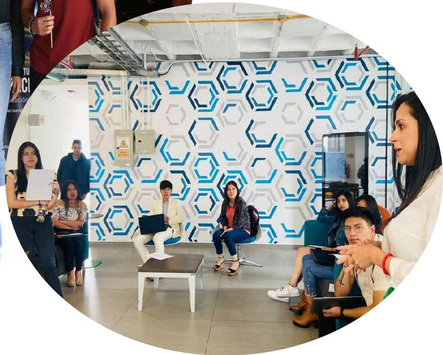
Torneo de Emprendimientos