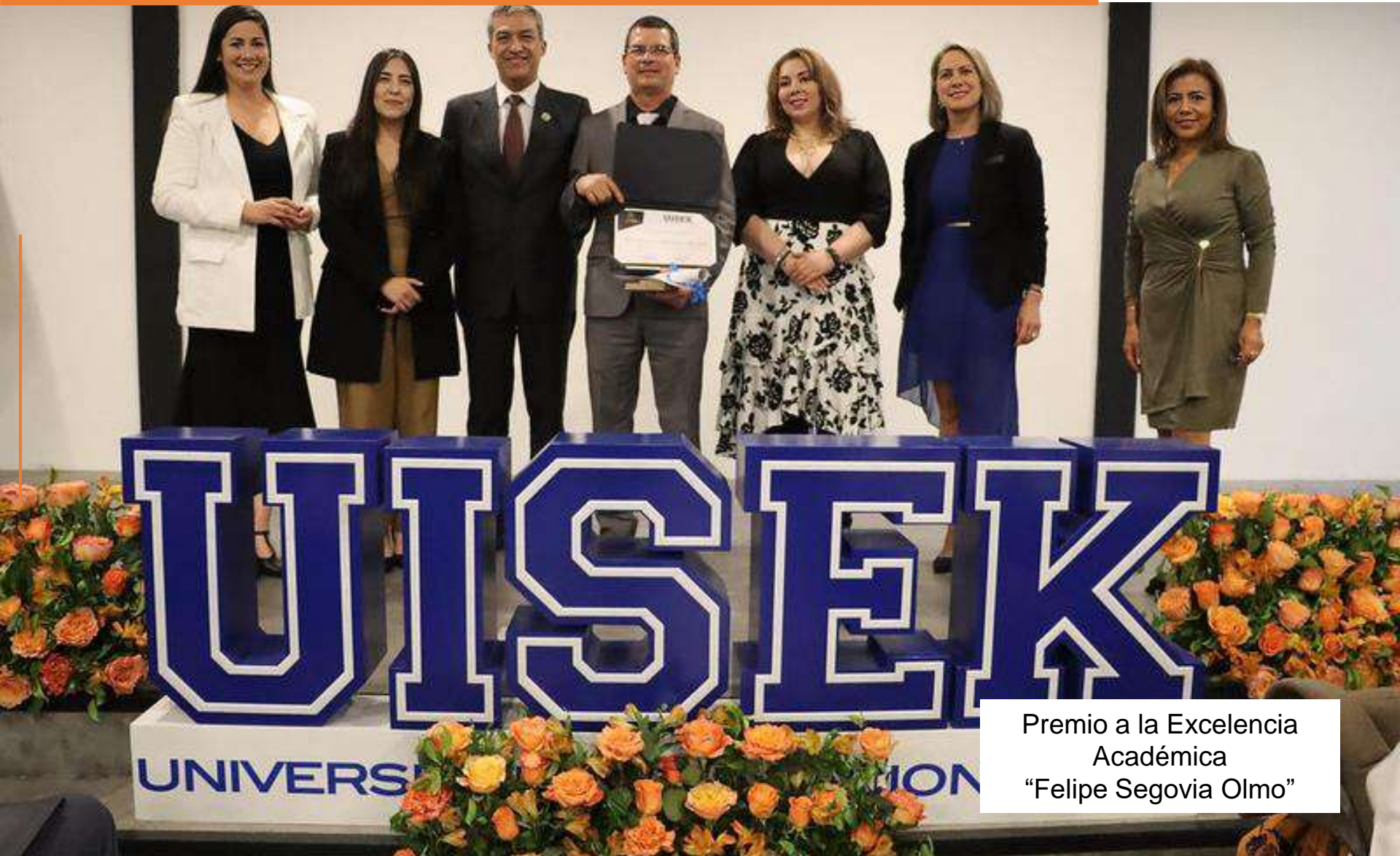
Premio a la Excelencia Académica “Felipe Segovia Olmo”