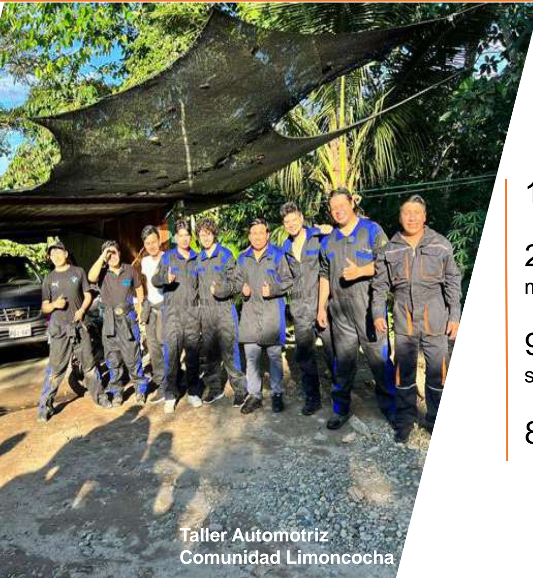
Taller Automotriz Comunidad Limoncocha