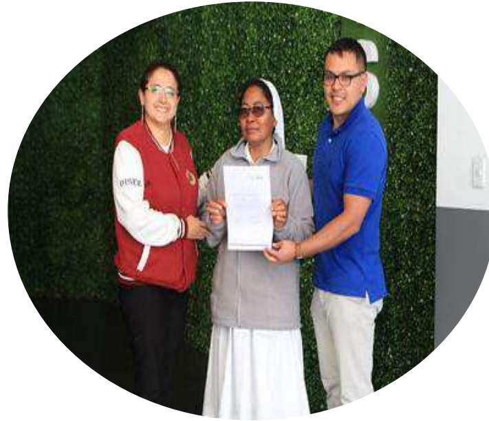
Donación de mobiliario