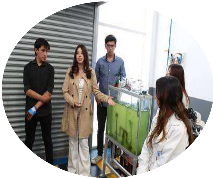
Semana de la Ingeniería