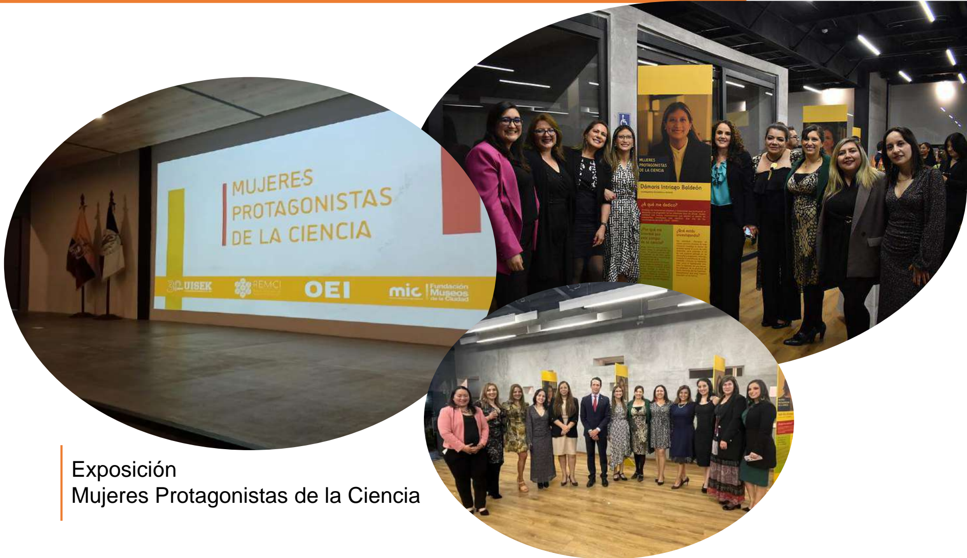
Exposición Mujeres Protagonistas de la Ciencia